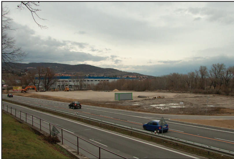
Pri vstupe do Jura sa buduje pokračovanie logistického centra. Povolenia pre tieto stavby boli vydané ešte v roku 2006.

aj potraviny napríklad na Neštichu (svojho času tam aj boli, ale boli prebudované na pohostinstvo). Bohužiaľ aj túto sféru ovplyvňuje trh. Podnikateľ, ak by ne-