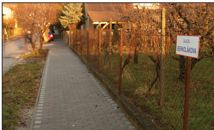
V rámci opráv chodníkov sa tento rok zrekonštruoval chodník na Bernolákovej.

Väčšinu projektov realizujeme z kapitálových výdavkov, sú však aj také, ktoré realizujeme koncom roka a to z ušetrených prostriedkov bežného rozpočtu. Tento rok sa nám takto podarilo pomôcť obyvateľom ulice Zuby, kde sme najkritickejšiu časť cesty v dĺžke cca 30m x 3,5m