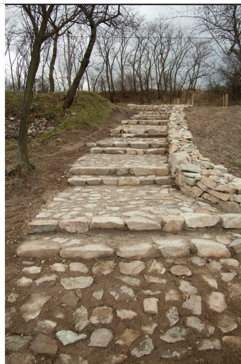
Priestor pri Pustom kostolíku dostal v uplynulých mesiacoch úplne novú tvár. V spolupráci s BSK sa tu vybudovalo cykloodpočívadlo, onedlho pribudne i Krížová cesta.

ihrisko na ulici Letohradská. Tam sme zároveň aj obnovili vodorovné dopravné značenie. Na jar nám tam pribudnú aj dopravné značky, takže mesto bude mať pre naše deti aj plnohodnotné dopravné ihrisko.