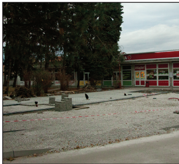
Park na Dukelskej dostane novú podobu.

Mesto vie o havarijnom stave pri stanici. Celý tento pozemok je v majetku Železníc Slovenskej republiky. V súčasnosti máme predjednanú najomnú zmluvu a spracovávame projektovú dokumen-